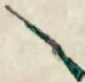
schön grün - das Malachit Gewehr

Die Teilnehmer des Classic Speed Events 2021 können nun ihre Teilnehmerbelohnung abholen: das Malachit Gewehr. Wer am Event teilgenommen hat, kontaktiert bitte das Event Support Team und gibt dort seinen Nickname, den Server und die Spielwelt an, also etwa " Flachschippe, de11 Arizona ". Das Gewehr wird euch dann zugestellt. Das internationale Event Support Team findet ihr unter https://support.innogames.com/connect/thewest/ts/en_US .