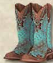
Legendärer Hut und Legendäre Stiefel - ein legendärer Zuwachs für das Legendäre Set

Wer sich selbst noch einmal einen legendären Überblick über das Legendäre Set verschaffen möchte, findet unter dem Link https://wiki.the-west.de/wiki/Legend%C3%A4res_Set in der The West Hilfe sowohl die Boni der Gegenstände und des gesamten Sets als auch die Kisten, die man kaufen muss, um es zu bekommen. Dass im Changelog des Updates neben der reinen Erwähnung der Einführung der beiden legendären Gegenstände auch noch die Verbesserung der Premiumkiste einen eigenen Punkt bekommen hat - schließlich sind darin jetzt diese zwei neuen legendären Gegenstände enthalten - versteht sich doch von selbst. Legendär, oder?