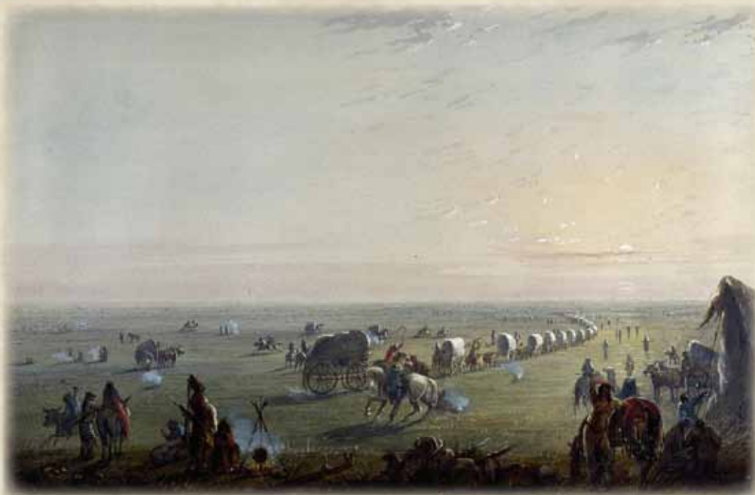
Alfred Jacob Miller artist QS:P170,Q2090482 ( https://commons.wikimedia.org/wiki/File:Alfred_Jacob_Miller_-_Breaking_up_Camp_at_Sunrise_-_Walters_371940142.jpg ), „Alfred Jacob Miller - Breaking up Camp at Sunrise - Walters 371940142“, als gemeinfrei gekennzeichnet, Details auf Wikimedia Commons: https://commons.wikimedia.org/wiki/Template:PD-author