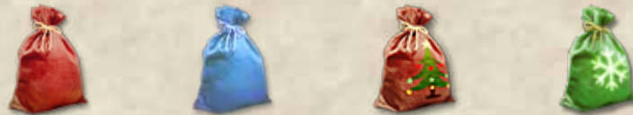
Mega-Weihnachtsbeutel 2013 - 2016

Die Weihnachtsbeutel, die immer ein zufälliges Item des betreffenden Jahres enthalten, sind nur mit Nuggets oder Bonds zu kaufen. Während in den letzten beiden Jahren die Beutel des aktuellen Jahres nicht alle Sets des laufenden Jahres enthielten, sind dieses Jahr im Mega-Weihnachtsbeutel 2016 auch tatsächlich alle Sets des Jahres 2016 enthalten, also auch die gerade erst ins Spiel eingeführten Sets Hombre und Mexikanischer Tänzer - eine spielerfreundliche Verbesserung.