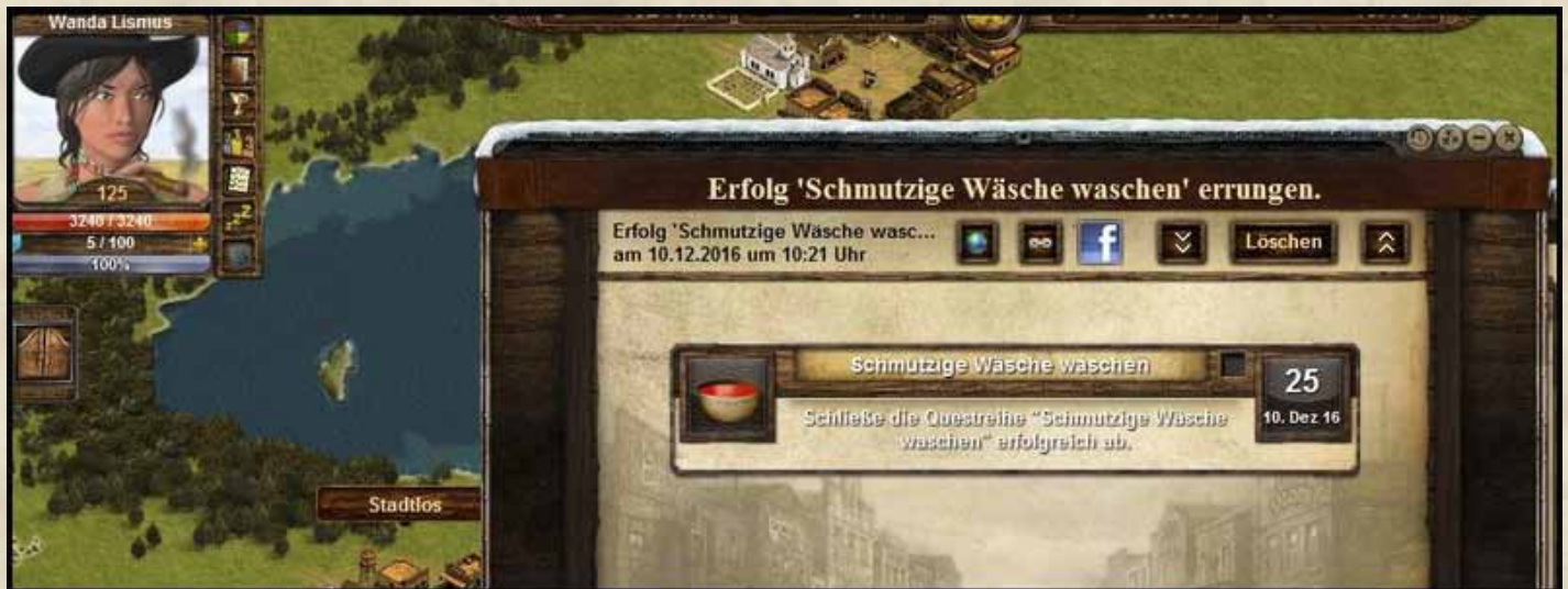
Erolg "Schmutzige Wäsche waschen"

P.S. Hier noch der passende Screenshot des Erfolgs zum Erhalt des Löscheiners.